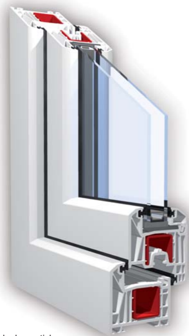
Petokomorni sistem duple zaptivke sa dubinom ugradnje od 70mm